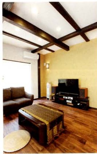
「Mさんが持っていた、アジア雑貨を活かしてデザインしています」と担当者談