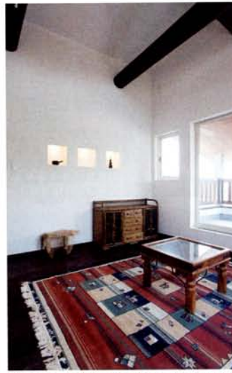
バルコニーに隣接する居室はセカンドリビングとして。高い天井が開放的