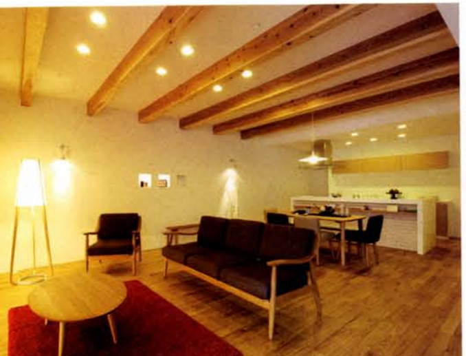
スタジオ内のショールーム。木の風合いに満ちたインテリアや照明使いなどここではスタンダードな同社の住まいを見ることが出来る。設備はすべて標準装備だ