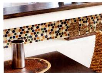
インテリアに散りばめられた、オリエンタルなデザイン。モザイクが印象的なカウンター