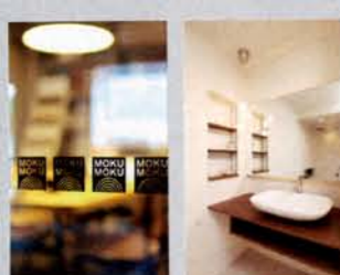
■スタジオ「MOKUMOKU」住所/佐賀県唐津市原1471-1 時間/10:00~18:00 定休/なし 問合せ/0120-70-1471

創業は1963年、材木店として産声を上げた同社が、住宅建築という分野で新しく活躍の場を設けたのは2007年。「約6畳の空間でスタッフ4名でのスタートでした」。翌年に本社ビル・ショールームを建設、その後も着々と実績を伸ばしてきた。右コラムでも記しているように2010年から唐津市での住宅着工実績が連続No1を達成し、スタッフもどんどん増え、ついには事務所に入りきれなくなるように。そこで、隣接する築40年の倉庫をリノベーション、「MOKUMOKU」というショールームも兼ねた新オフィスを設立した。お客様からスタッフの顔がよく見えるオープンな空間。アットホームな雰囲気がショールームフロアにもこぼれてきて居心地がいい。新しいステージから発信するこれからの家づくりが楽しみです。