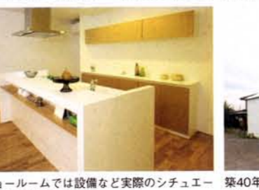
ショールームでは設備など実際のシチュエーションで体感できる