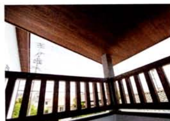
アジアリゾートの気分が満喫できるバルコニー。風通しも良く居心地は最高！