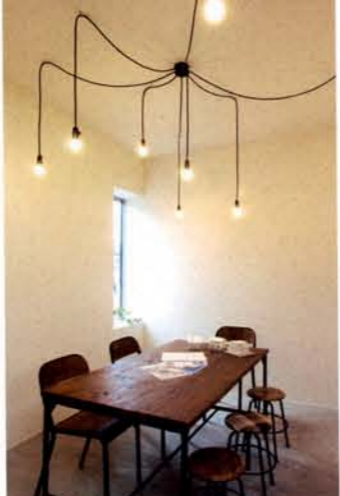
パートナーさん用の打ち合わせ室。シャビッシュな雰囲気のインテリア