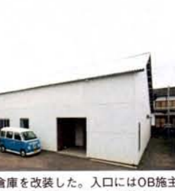
築40年の倉庫を改装した。入口にはOB施工様宅を訪問する「アフターカー」が停まる