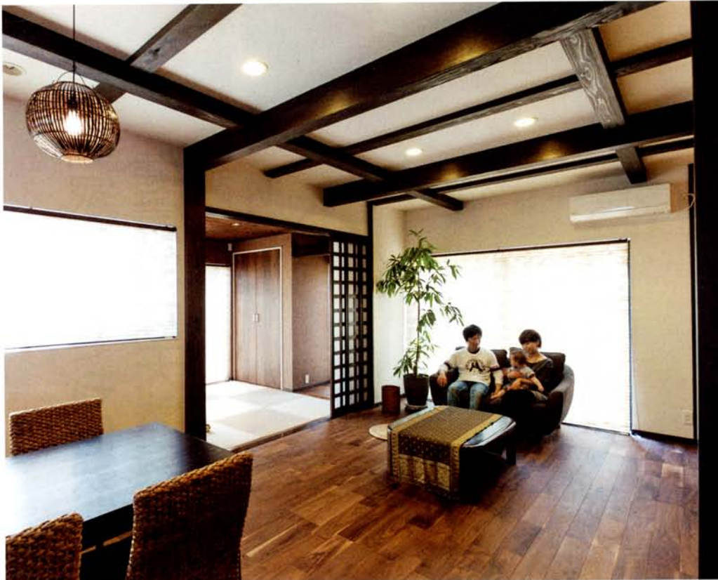
Mさんお気に入りのリビング。幅広のフローリング、太めの柱、格子のビッチを大きめに、自然素材を使って柔らかな雰囲気に。これがお部屋をバリ風に演出するコツ。和室には蓋天井が施され、アジアな雰囲気たっぷりのほっと落ち着く空間