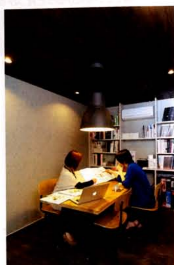
お客様打ち合わせ室の風景。実際の建材をお客様が体感しながらイメージできる