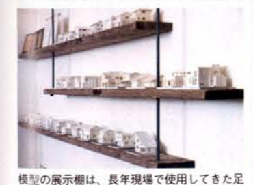
模型の展示棚は、長年現場で使用してきた足場板。「歴史を感じる、愛着あるものです」