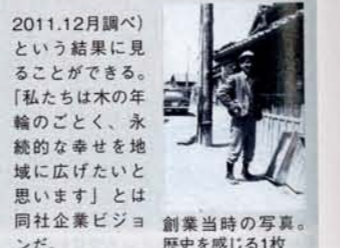
創業当時の写真。歴史を感じる1枚

材木店から始まり良質の佐賀県産材を供給してきた同社。その後高度成長期にともない建築の請負業を始めたという歴史を持つ。創業から半世紀、無借金経営で堅実な歩みを続けている。その信頼の実績は唐津市で住宅着工実績が連続総合1位(フクニチ住宅新聞