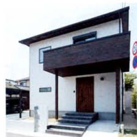
周囲の環境に合わせたシンプルな外観。所々にアジアテイストをプラス