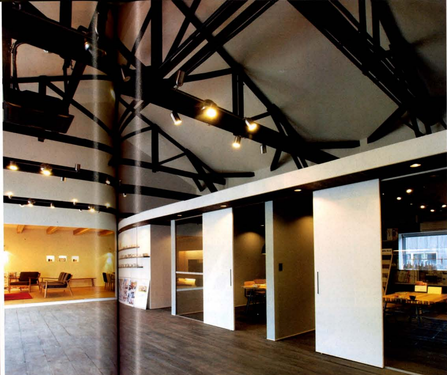
「ここで実際に職人が木を加工していたんですよ」という「MOKUMOKU」の中。ショールーム、実例展示、相談ブース、建材の比較展示などが揃う。家づくりに関することはここに足を運べばOK! (写真はすべて「MOKUMOKU」で撮影)